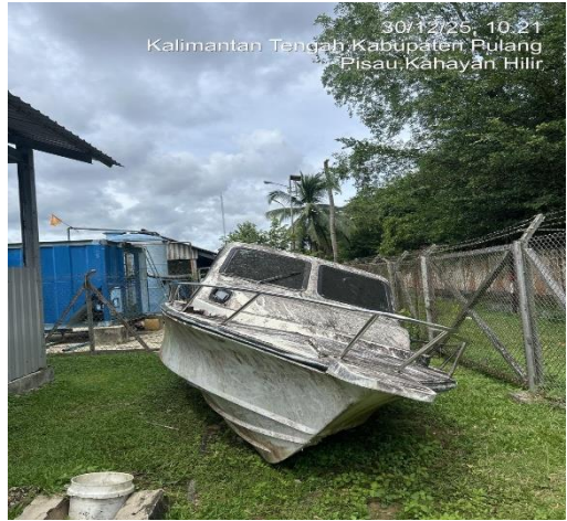
30/12/25, 10.21 Kalimantan Tengah, Kabupaten Pulang Pisau, Kahayan Hilir