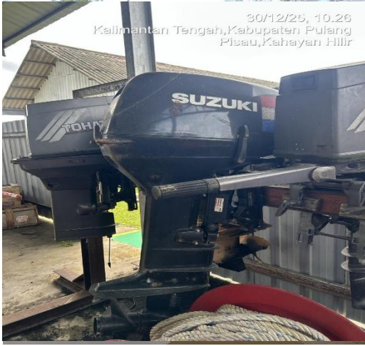
30/12/25, 10.26 Kalimantan Tengah, Kabupaten Pulang Pisau, Kahayan Hilir