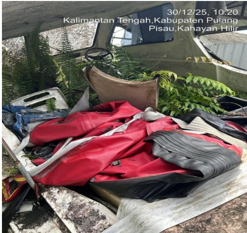
30/12/25, 10.20 Kalimantan Tengah, Kabupaten Pulang Pisau, Kahayan Hilir