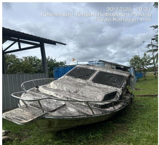
30/12/25, 10.21 Kalimantan Tengah, Kabupaten Pulang Pisau, Kahayan Hilir