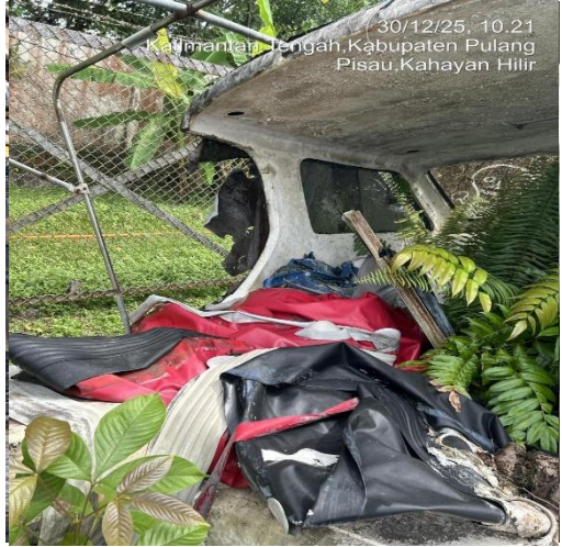
30/12/25, 10.21 Kalimantan Tengah, Kabupaten Pulang Pisau, Kahayan Hilir