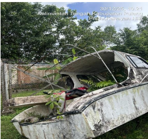
30/12/25, 10.21 Kalimantan Tengah, Kabupaten Pulang Pisau, Kahayan Hilir