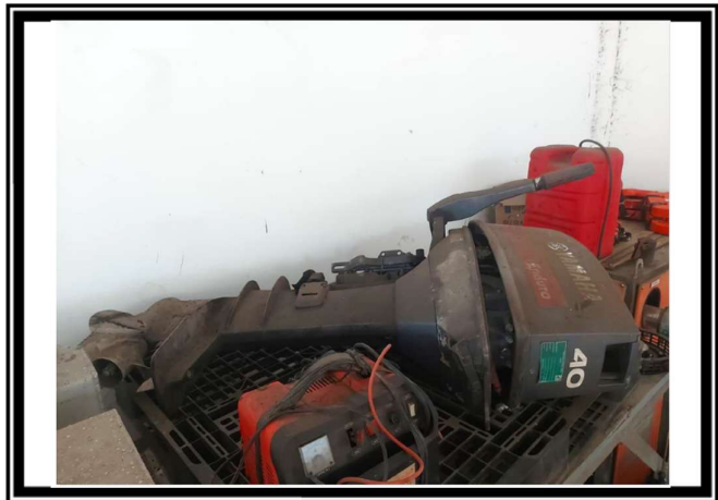
TAMPAK MESIN ASET